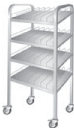
pojízdný regál na sklenice