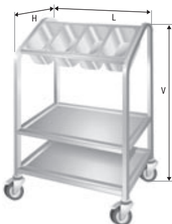
pojízdný zásobník táců a příborů