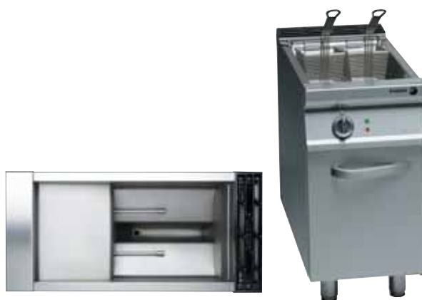
Pohled shora na fritézu FGCL9-05

Elektrické napájení: 230 V, jednofázové.